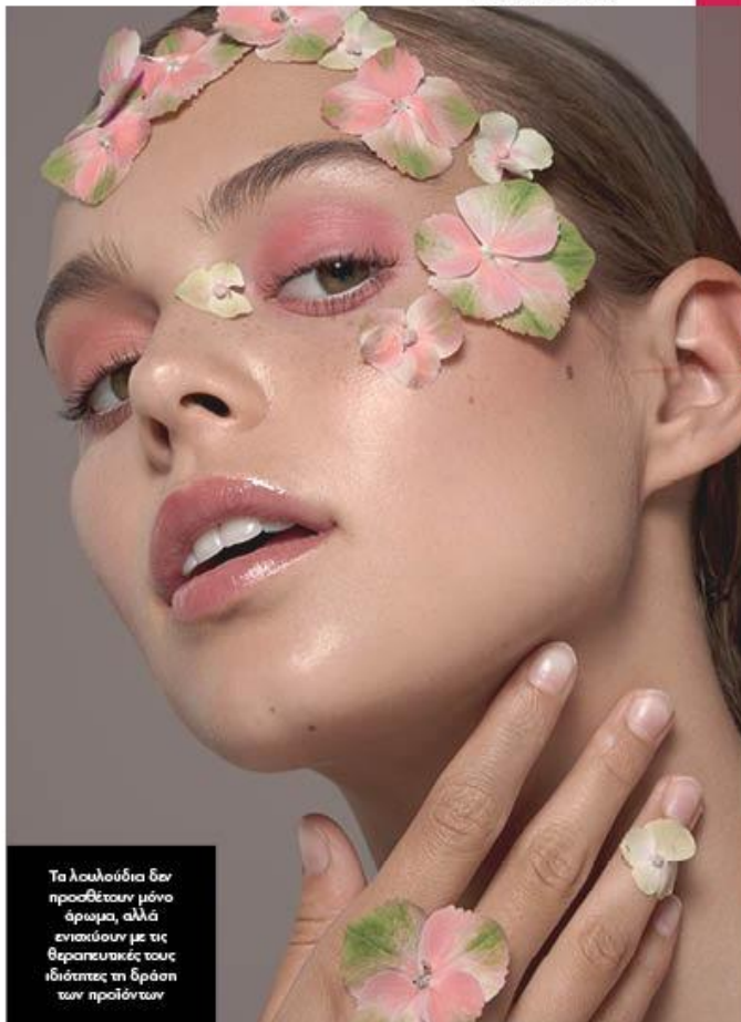
Τα λουλουδία δεν προσθέτουν μόνο άρωμα, αλλά ενισχύουν με τις θεραπευτικές τους ιδιότητες τη δράση των προϊόντων

Πέρα από το ότι συμβολίζουν τον έρωτα και αυτό και μόνο τα κάνει το πιο ισχυρό καλλυντικό, τα τριετή φυτά έχουν αποδεδειγμένα συγκεκριμένες ιδιότητες στη βελτίωση των ούλων, των ρυτίδων και των ραγάδων. Αυτό όμως δεν ισχύει μόνο για τα βασικά ροζοί, αλλά και για πολλά ακόμη άνθη. Είκοσις που έχουν παρακολουθήσει από κοντά το ογκολογικό-βιολογικό-πράσινο κίνημα στην ομορφιά, θα έχουν καταλάβει ότι η τάση είναι να αντικαθίσταται τα χημικά συστατικά με εσουλίσματα λουλουδιών και φυτών. Πολλές φορές μάλιστα οι εκτέτες με τις δραστηριότητες ενός προϊόντος θυμίζουν κατάλογο ανθοπωλείου.