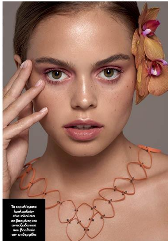
Τα εσουλίσματα λουλουδιών είναι πλούσια σε βιταμίνες και ανσοξειδωτικά που βοηθούν την επιδερμίδα